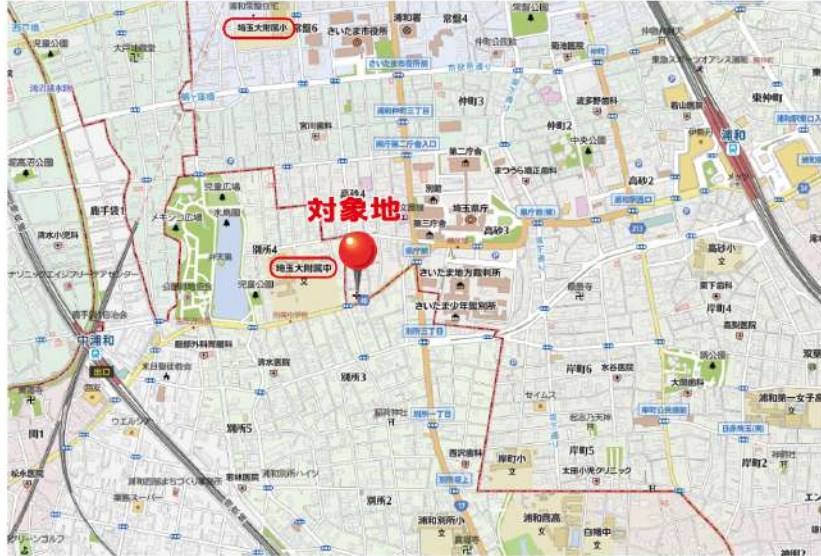
選択可能校として国立埼玉大学教育学部附属小学校・中学校も徒歩圏内です。